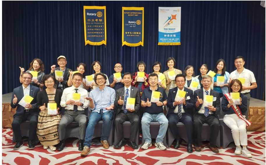
第 735 次例會合影