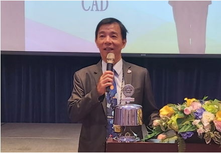
社長 CAD 報告