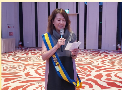
例會糾察 KK 夫人