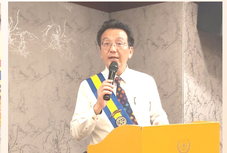
樂透摸彩時間 ~ 恭喜 Sauna 獲得貳獎, YoungBank 獲得頭獎