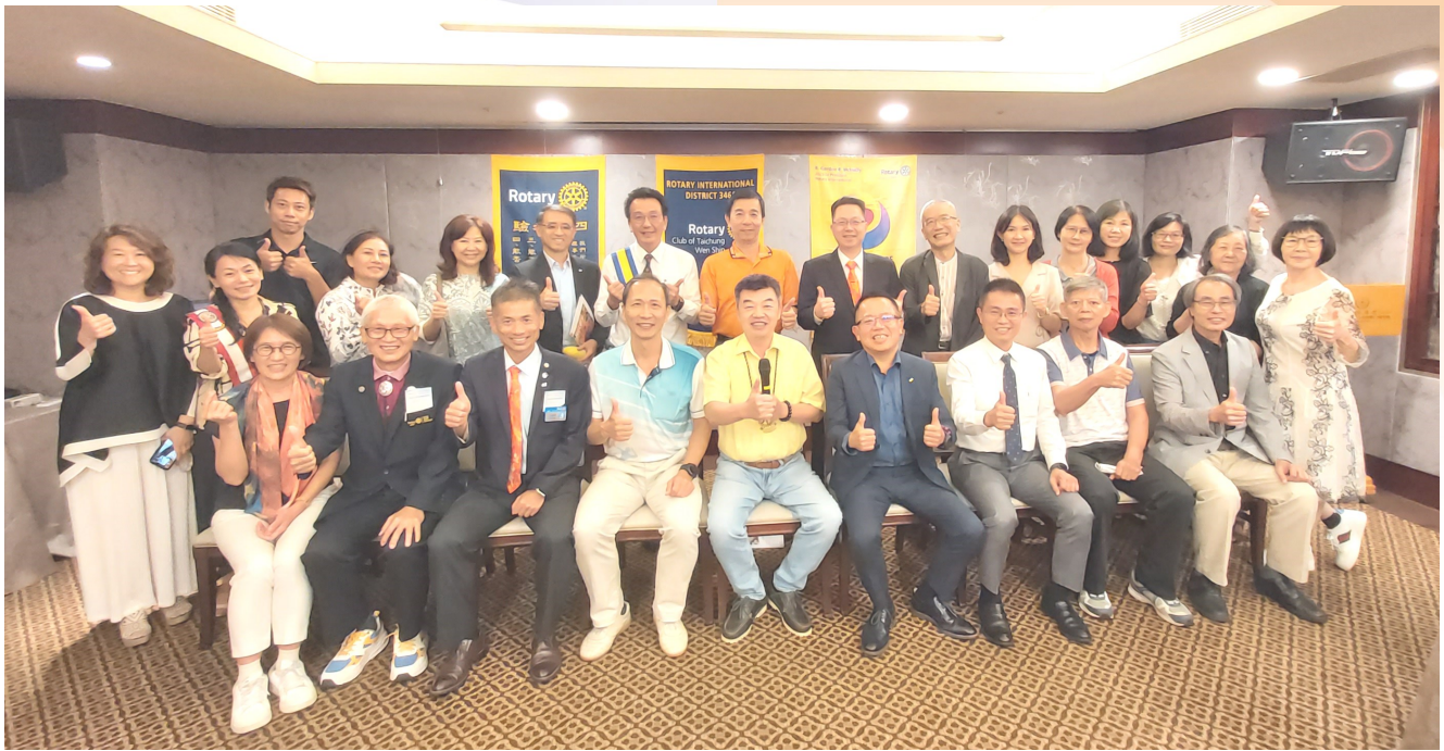
第 7 1 2 次 例 會 合 影