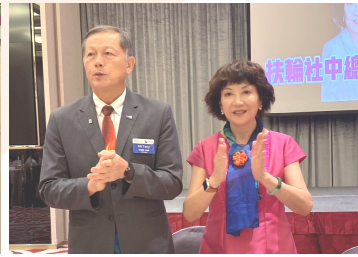
感謝總監伉儷及地區團隊蒞社指導