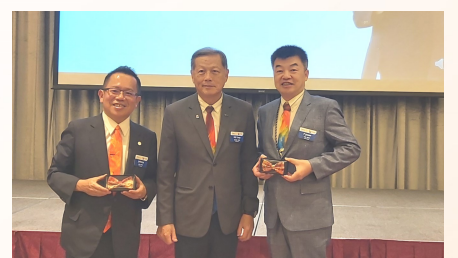
總監致贈 社長暨秘書領結