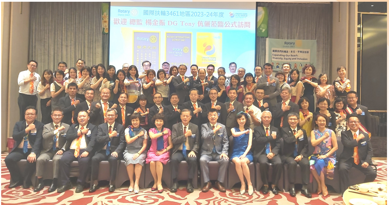
第 709 次例會-總監伉儷暨地區團隊蒞臨公式訪問合影