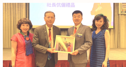
總監致贈 社長伉儷禮品