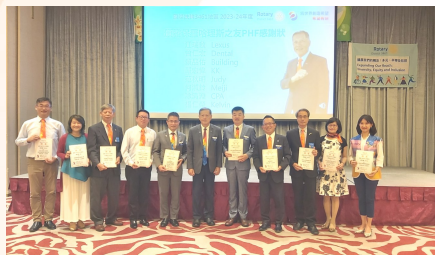
總監頒發地區團隊聘書