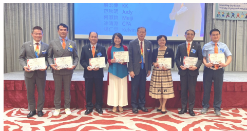
頒發捐獻國際扶輪 基金精美禮品及感謝狀