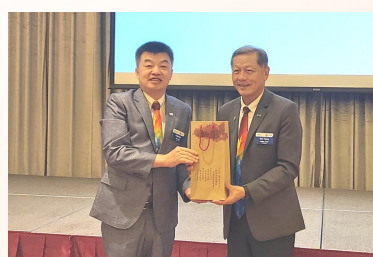
社長致贈總監禮品