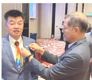
總監致贈每位社友 Rotary 標誌徽章