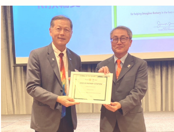
頒發 2022-23 年度 RI 扶輪獎