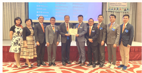
頒發扶輪之子計畫認養感謝狀