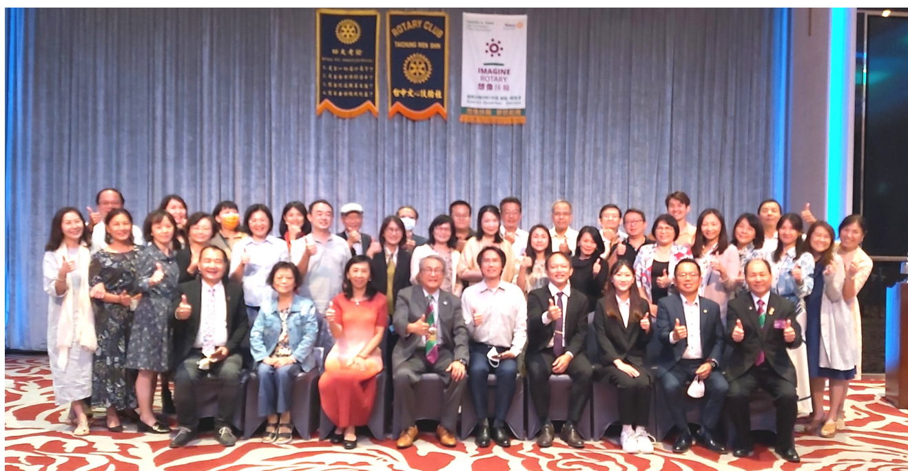
第 6 9 0 次 例 會 合 影