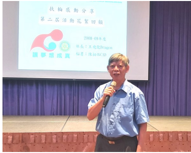
扶輪感動-PP Dragon 第二屆活動花絮回顧