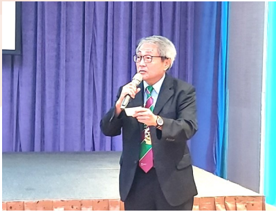
社長 Value 報告