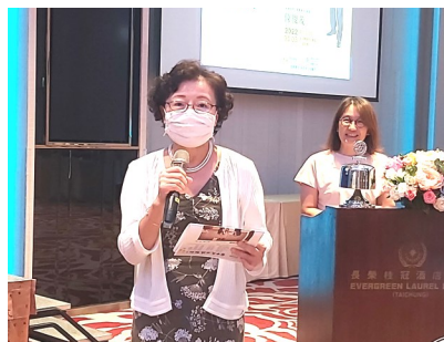
Meiji 介紹 Speaker 長曜國際法律事務所律師 Attorney 社友