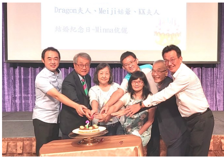
8 月份生日及結婚紀念慶祝