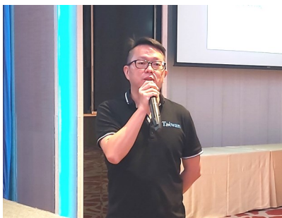
聯誼主委 Young Bank 報告