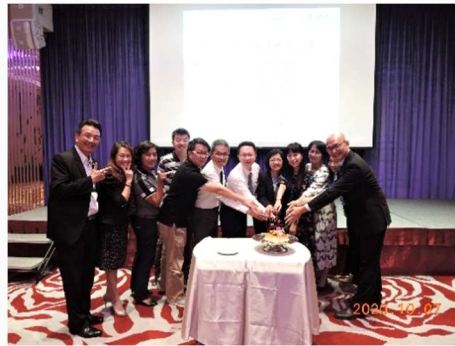
10 月份生日及結婚紀念慶祝