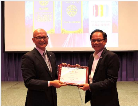
頒發 2019-20 年度 RI 扶輪獎