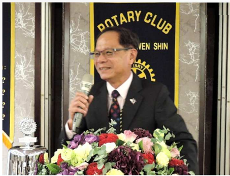
社長 Charity 報告