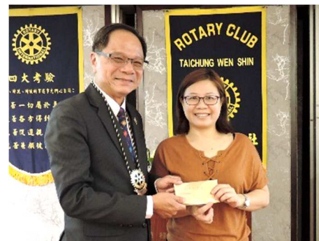
5 月份生日 & 結婚紀念慶祝