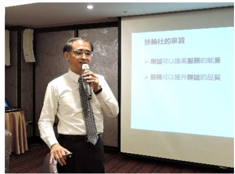
扶輪 ABC 時間~PP. CPA