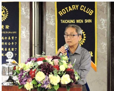
秘書 Value 社務報告