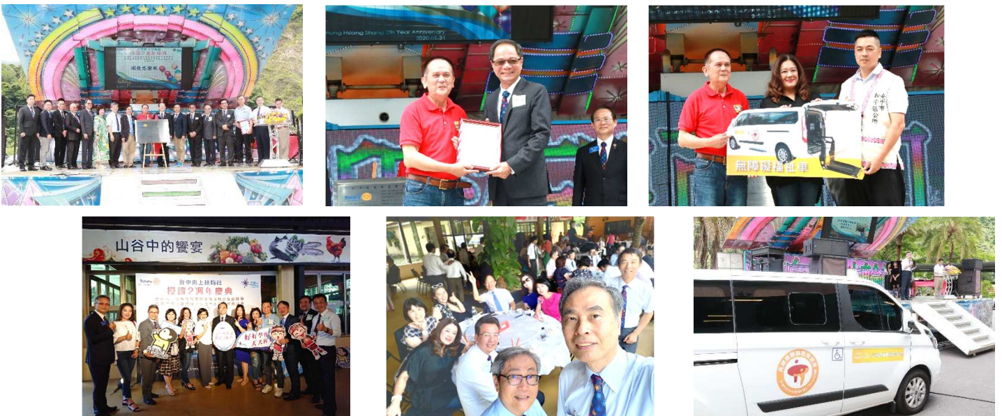
2020.05.31 台中向上扶輪社社慶 暨 全球獎助金專案 捐贈和平區南勢部落社區生活用水衛生改善計畫捐贈儀式