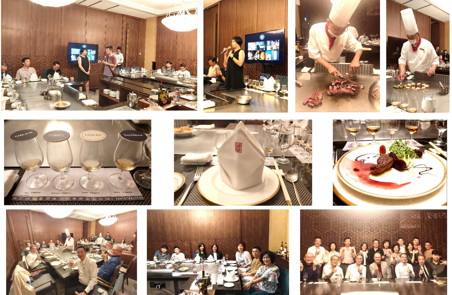
2020.05.27 食酒聚 5 月迎夏餐會~紅花鐵板燒旗艦店