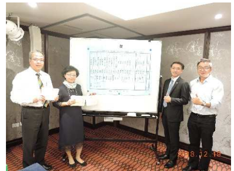
社員大會~選舉第 13 屆理監事暨第 15 屆社長提名人