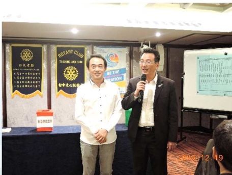
第 15 屆社長提名人 KK 介紹秘書 Interior