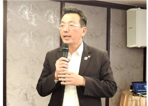
服務計畫主委 KK 報告