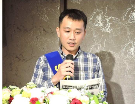
秘書 Sigma 報告