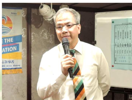
PP. CPA & PP. Book 分享社務心得