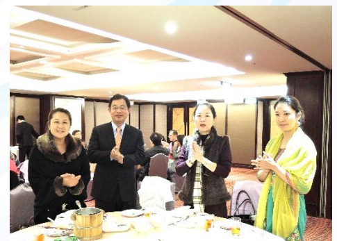
歡迎台中國美扶輪社社友蒞臨