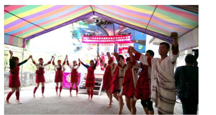
20170304 南投縣仁愛鄉互助村中原部落簡易自來水設施改善工程完工捐贈儀式