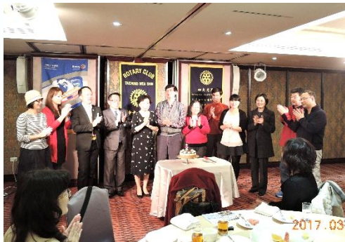
3 月份生日及結婚紀念慶祝