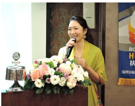
IS 夫人宛伶 印度瑜珈之旅分享