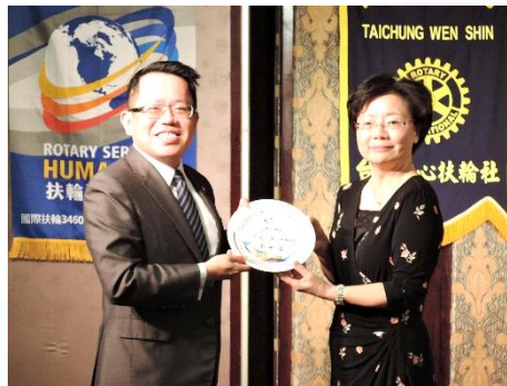
恭喜文心社獲得接力馬拉松 扶輪 第七名