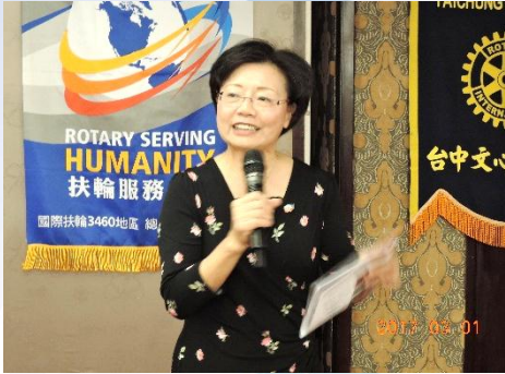
社長 Meiji 報告