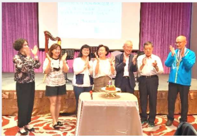
5 月份生日及結婚紀念慶祝