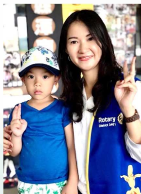
2018.07 第一次參加的服務計畫

文心社有許多我的貴人,讓我這個菜鳥在短短時間,就有機會可以參與地區總監公訪團隊、地區公共形象關係團隊、全國金輪獎扶輪評審...增加了我的視野和想法;期許自己只要有新的文心家人加入時,要用我的初心和同理心,多一點溫暖關心對方,因為,我的文心社真的很可愛!