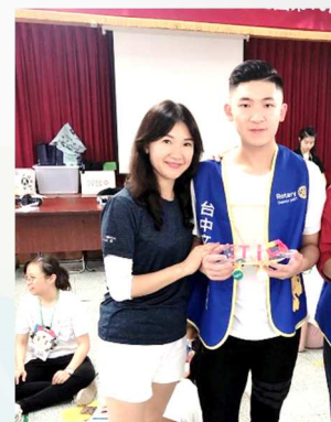
2020.07 最近一次參加的服務計畫