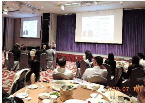
感謝 DGE Trading 蒞臨文心社分享「扶輪 30 載」