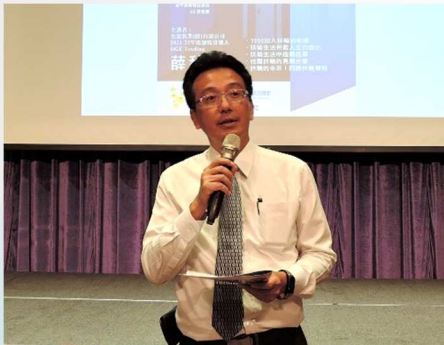
KK 介紹 DGE Trading