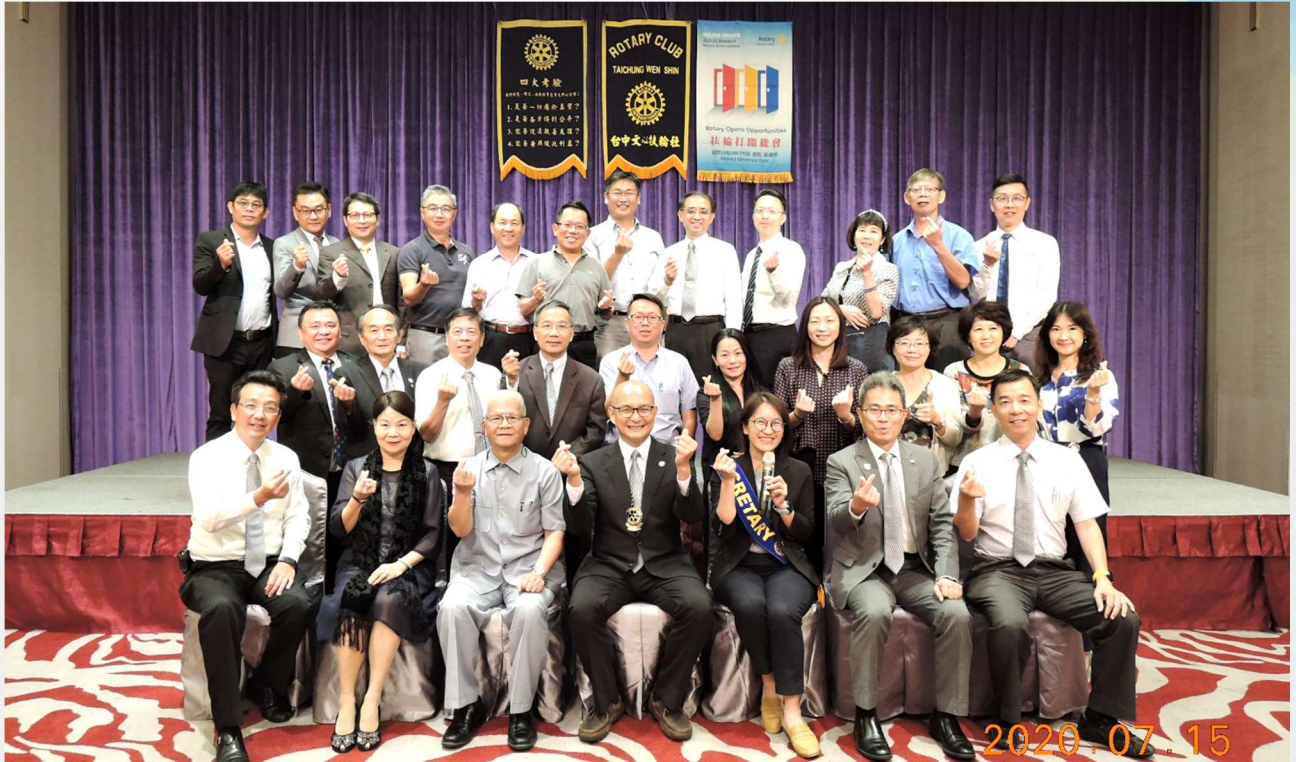
第 6 3 8 次 例 會 合 影