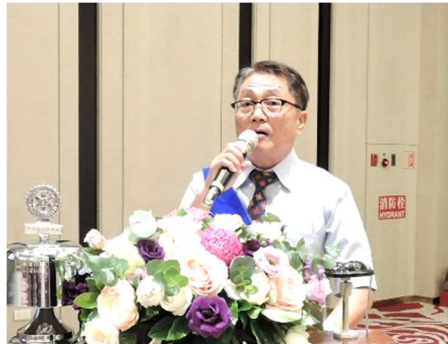
秘書 Value 社務報告