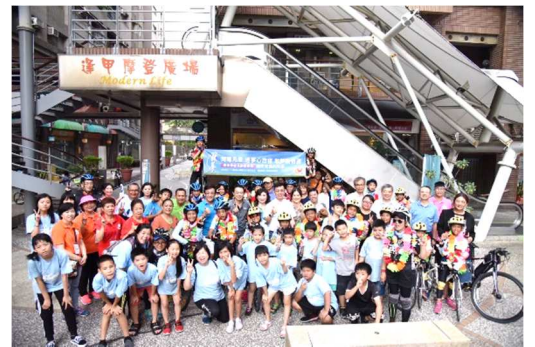
社友 Education 協會主辦「愛在台灣. 希望無限」親善大使環台公益活動啟航&回航花絮

服務計畫委員會在 7 月 20 日舉辦的社區服務活動，感謝眾多社友的參與，當天除了捐贈物資外，社友們也熱情地陪伴立達啟能中心的院生做桌遊活動，相信大家一定有一番不同的體驗。