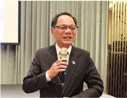
社長 Charity 報告